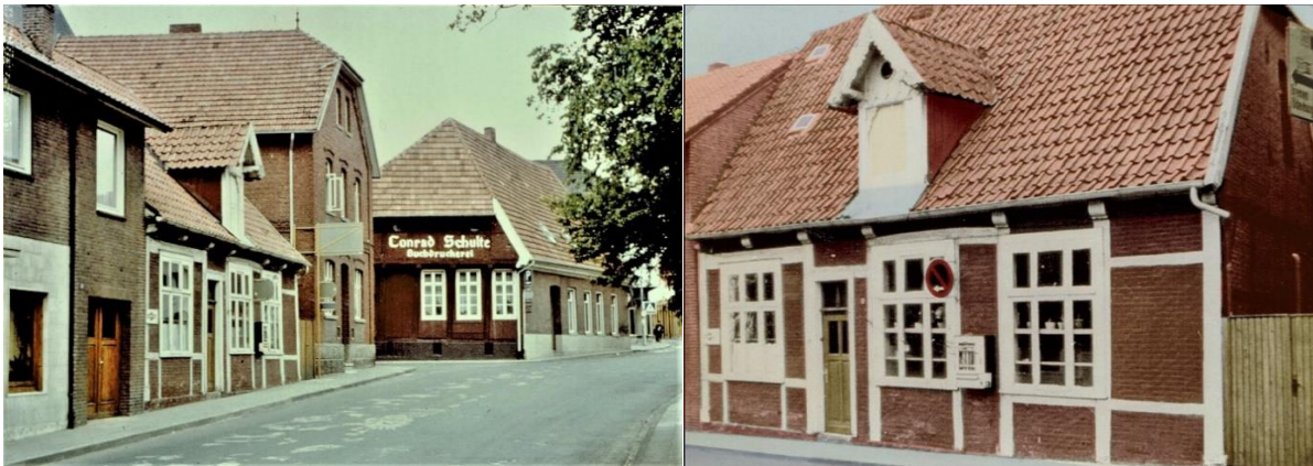
Ehemalige Gaststätte Neteler in der Hasestraße. Rechte Aufnahme nachträglich koloriert.